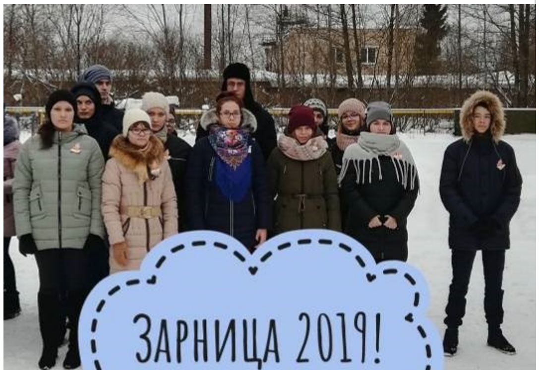
Фото 11 класса

Благодарим всех ребят за участие в мероприятии и поздравляем победителей!