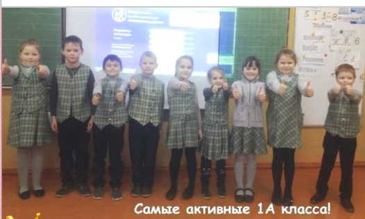
Самые активные 1А класс!

С 30 ноября по 11 декабря 2020 года учащиеся начальной школы стали активными участниками Всероссийской онлайн-олимпиады «Безопасные дороги» на знание основ безопасного поведения на дорогах на образовательной платформе Учи.ру. Олимпиада представляла собой цепочку интерактивных обучающих и тестовых заданий, изложенных в интересном для младшеклассников формате.